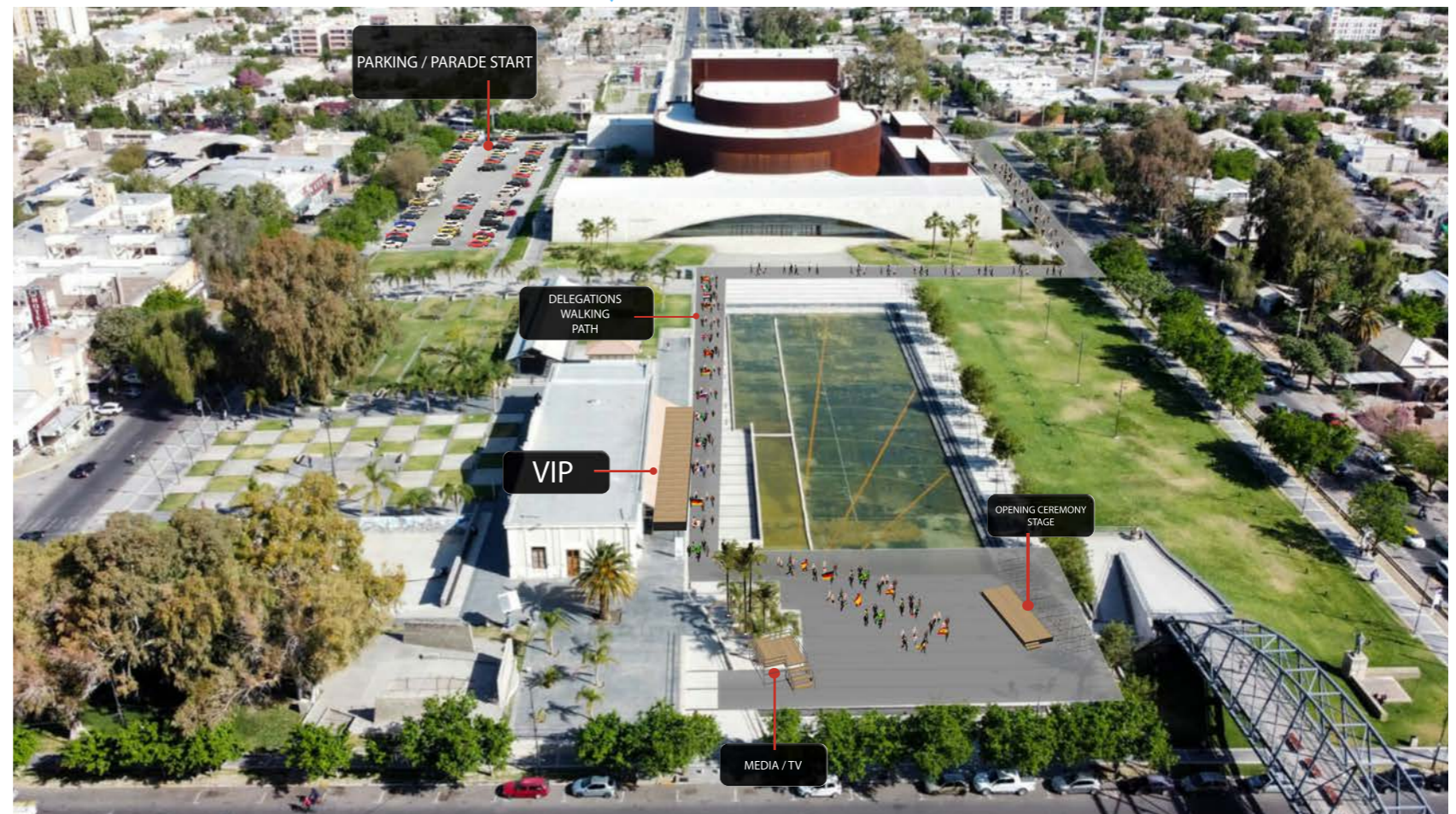
Map of the Parade & Opening Ceremony